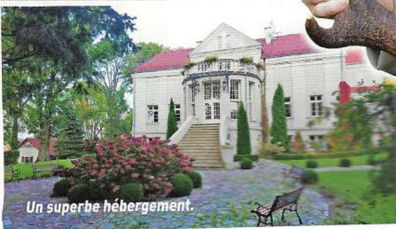
Un superbe hébergement.

prélever des trophées entre 5 et 9 kg. À son retour il jubilait : « cela a été un enchantement du début à la fin », nous a-t-il dit en précisant : « l'organisation AND est parfaite, l'hébergement très confortable, les guides merveilleux, le milieu magnifique et les animaux présents en très grand nombre. »